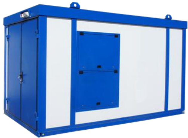
Дизельная электростанция в блок контейнере «Север»

Дизель-генераторные установки в зависимости от условий эксплуатации могут быть выполнены в следующих исполнениях: